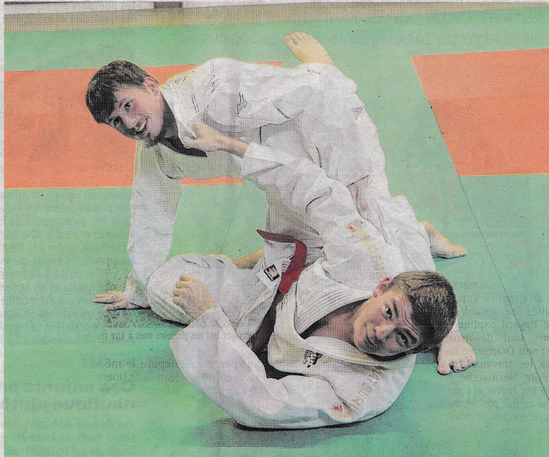
Les deux garçons participent au championnat sans pression excessive

Les deux garçons abordent donc sans pression excessive le ren-